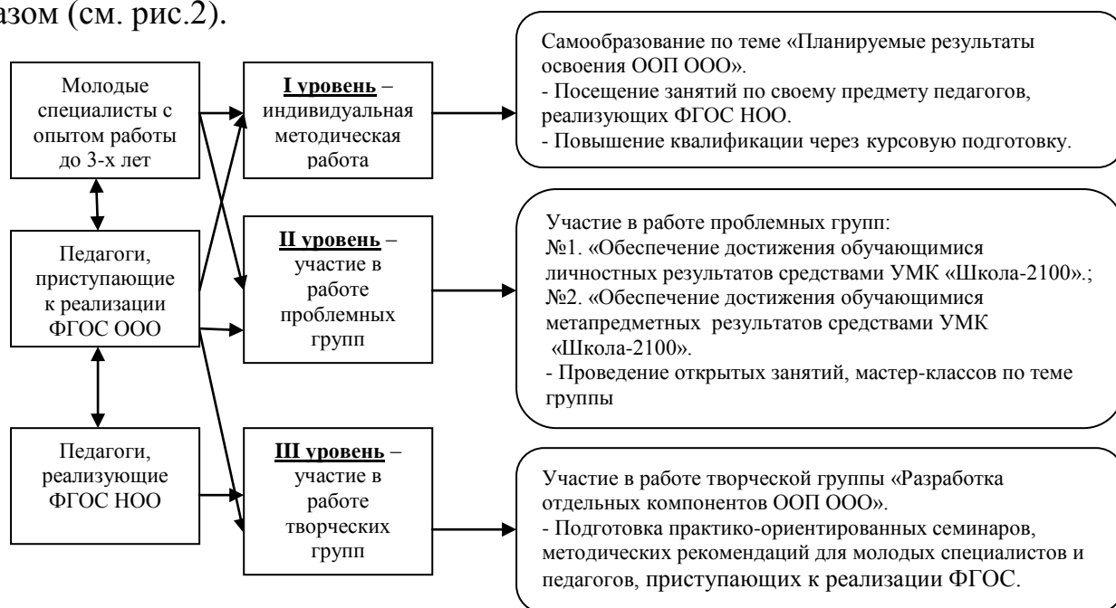
Рис.4. Модель управления научно-методической работой в МОУ «СОШ№39 им. Г.А.Чернова» г.Воркуты

Для обеспечения взаимодействия между субъектами организационной структуры НМР и реализации намеченных изменений была разработана модель управления научно-методической работой, которая выглядит следующим образом (см. рис.2).